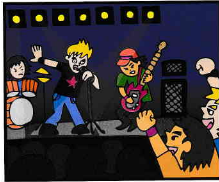
不特定の客に歌手がその場で歌う歌、バンドの生演奏等を聴かせる行為