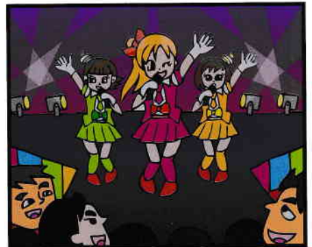
不特定の客にショー、ダンス、演芸その他の興行等を見せる行為