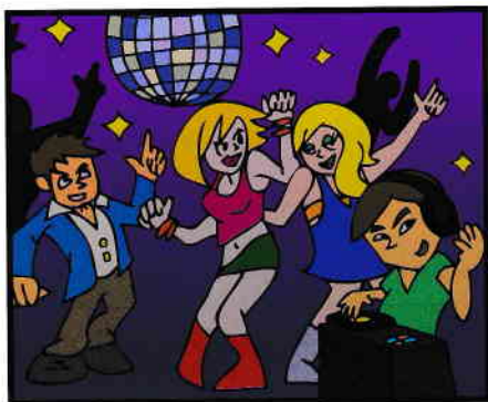
客にダンスをさせる場所を設けるとともに、音楽や照明の演出等を行い、不特定の客にダンスをさせる行為